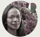
Misa à Madagascar

A Madagascar depuis toujours Conseillère depuis 13 ans Parle Français