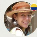
Marine en Colombie

En Colombie depuis 5 ans Conseiller depuis 2 ans Parle Français, Espagnol, Anglais